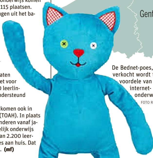
De Bednet-poes, die verkocht wordt ten voordele van het internet-onderwijs.