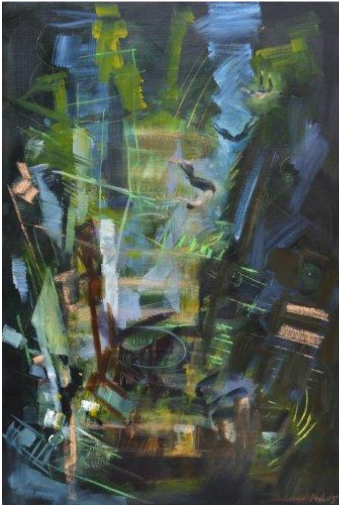
Droom (2017, olieverf op doek, 120 X 80 cm)