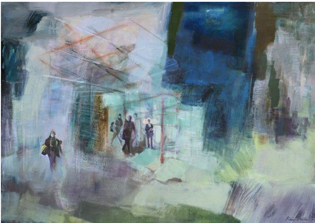
Speechless Walkers (2020, olieverf op doek, 85 x 120 cm)