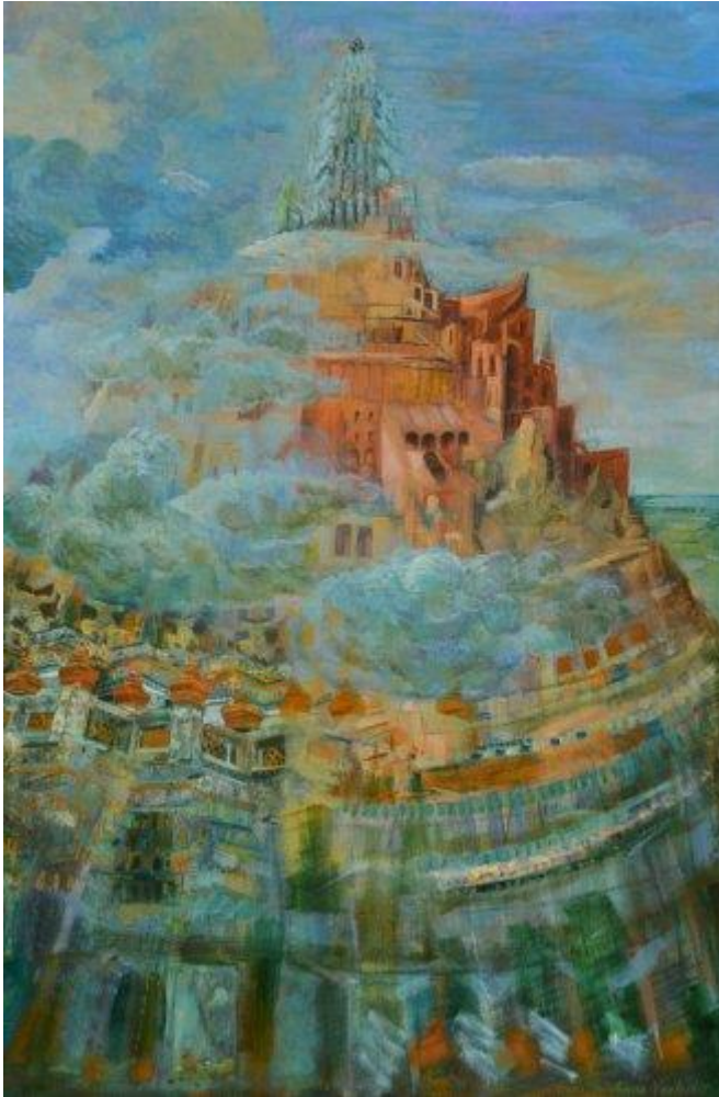
New Babylon (2014, olieverf op doek, 120 X 80 cm)