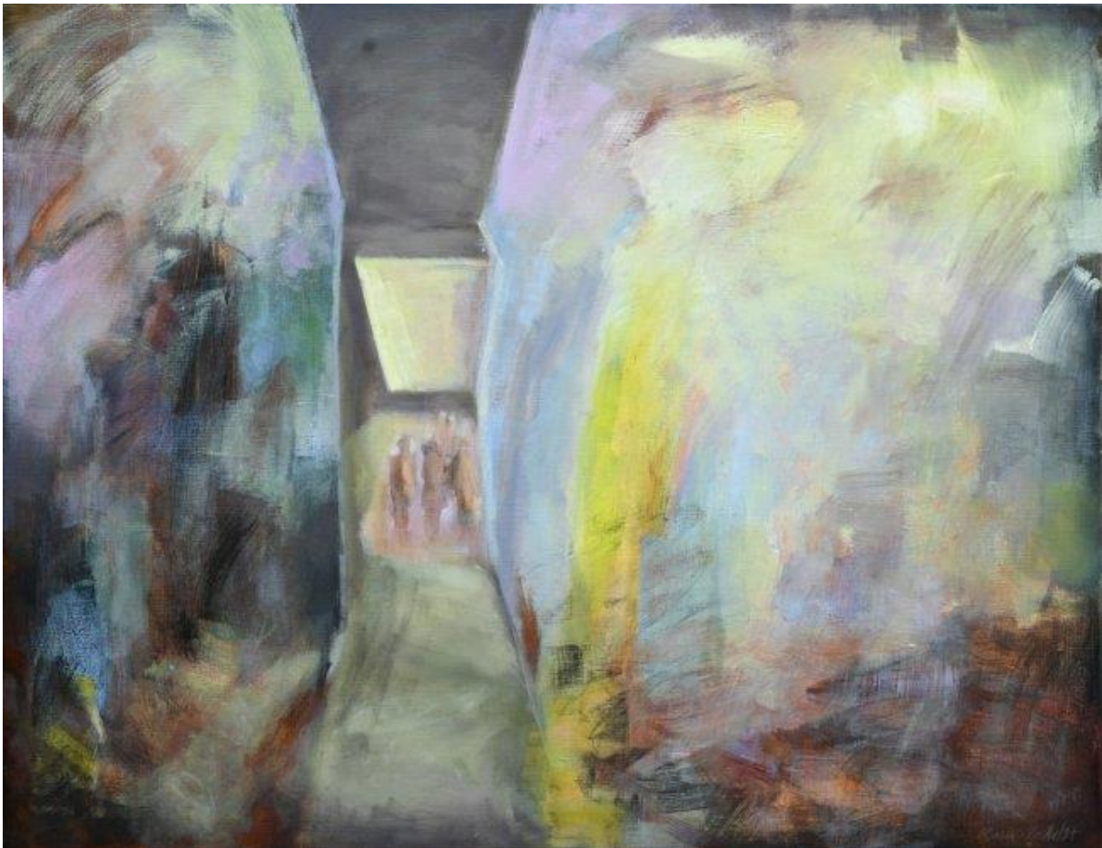
Looking forward to seeing you (2020, olieverf op doek, 100 x 130 cm)

waarbij ook het licht in de ruimte een belangrijke rol ging spelen. Het werd een echte 'ruimte' in alle betekenissen van dit begrip, niet enkel beperkt tot het architecturale. De beginperiode werd eerder gekenmerkt door isolement, als gevolg van de beperkte of ontbrekende communicatiemogelijkheden, maar uiteindelijk werd het uitvergroot naar een publieke ruimte. Om deze ruimtes te reconstrueren verzamelt ze beelden, maar werkt deze dan verder uit vanuit haar visueel geheugen. Plaatsen waar ze gewoond en gewerkt heeft, hebben veel impact op haar gevoelens en haar werk. Waar er oorspronkelijk nog mensen aanwezig waren in deze ruimtes, werden deze in de loop der jaren eerder kleine silhouetten, niet refererend naar familieleden, maar universeeler, vanuit haar verbeelding meer als archetypes bedoeld.